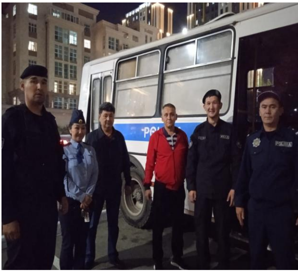
Рейдовые мероприятия совместно с ювенальной полицией