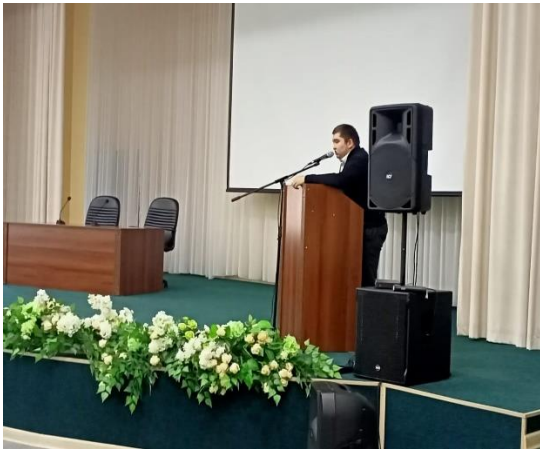
Лекция МВД по экстремизму