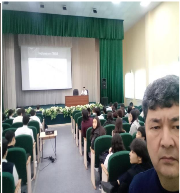
Лекции о вредности ВЕБ сигарет и психотропных веществ