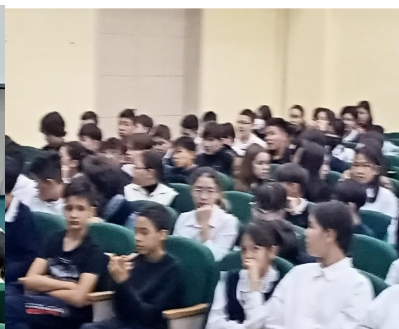
В целях выявления фактов вымогательства проведения опроса