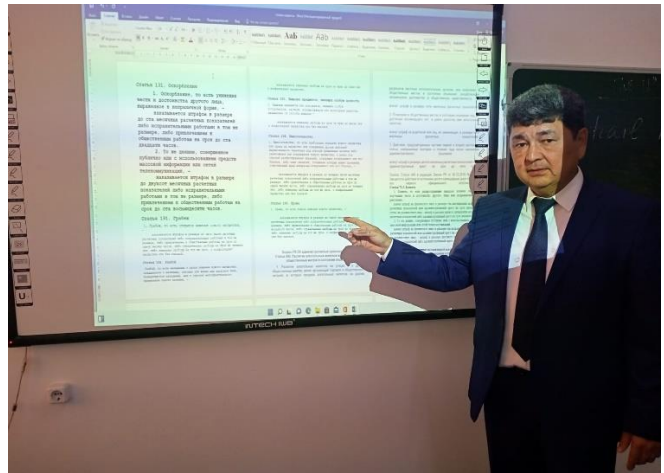
Мероприятия по изучению законов и статей КоАП