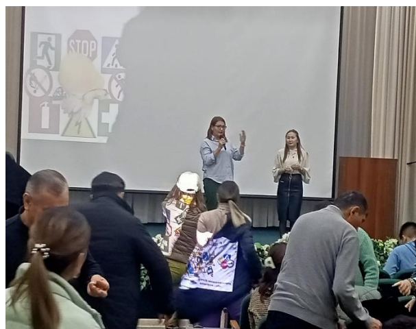
Работа с родителями совместно с психологами